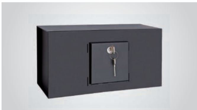
Sistema de apertura mediante llave de puntos.