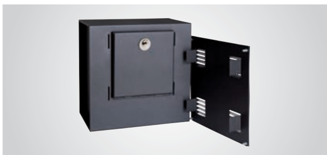
Retirando la rejilla de seguridad accedemos a la cerradura de la caja.