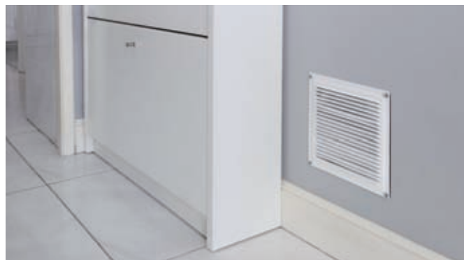
Puede ser ocultado en cualquier rincón de la vivienda o inmueble.