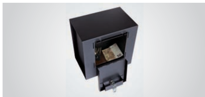
Dispone de capacidad para guardar pequeños objetos de valor.