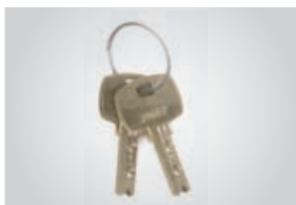
Sistema de apertura mediante cerradura con llave de puntos.