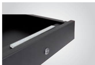
La caja dispone de un bulón plano de 200x20mm.